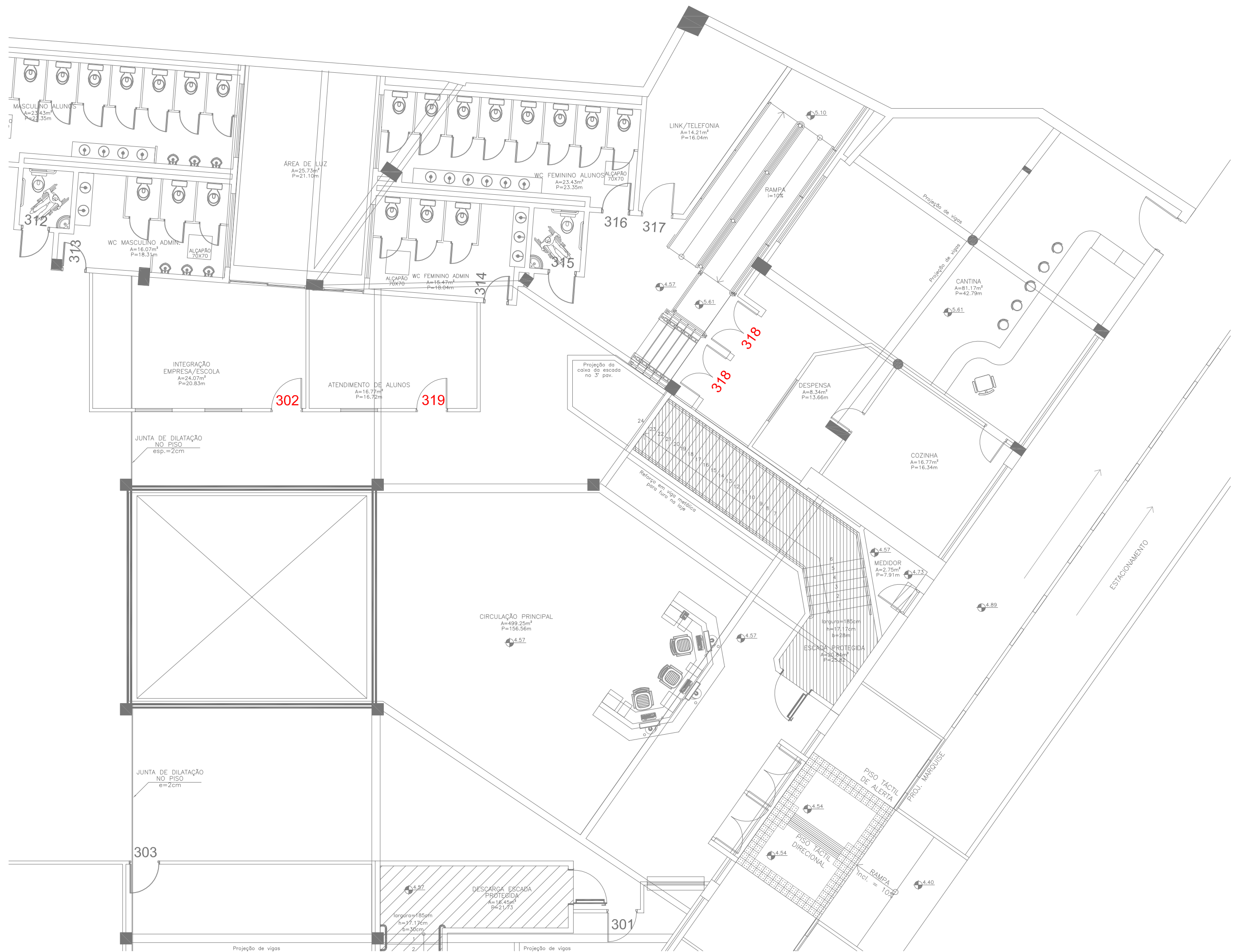
NUMERAÇÃO DE PORTAS DO 2º PAVIMENTO ESCALA: 1/100